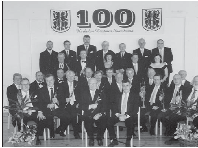
Karhulan Läntinen Soittokunta