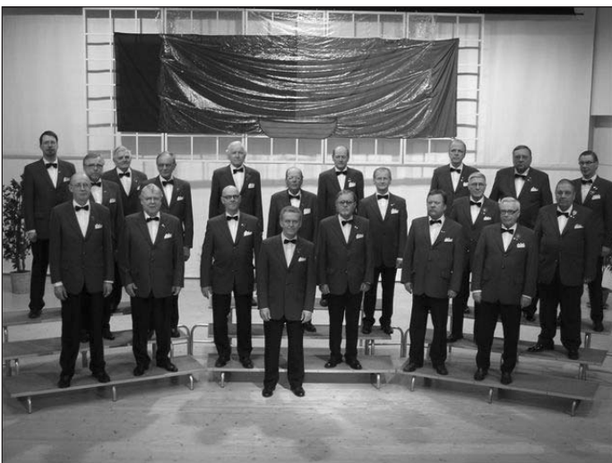
Harjavallan Työväen Mieskuoro