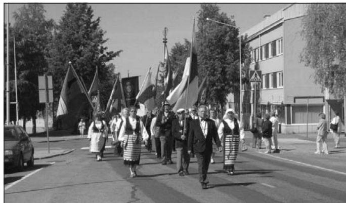
Juhlakulkue halki Imatran.