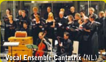
Vocal Ensemble Cantatrix (NL)