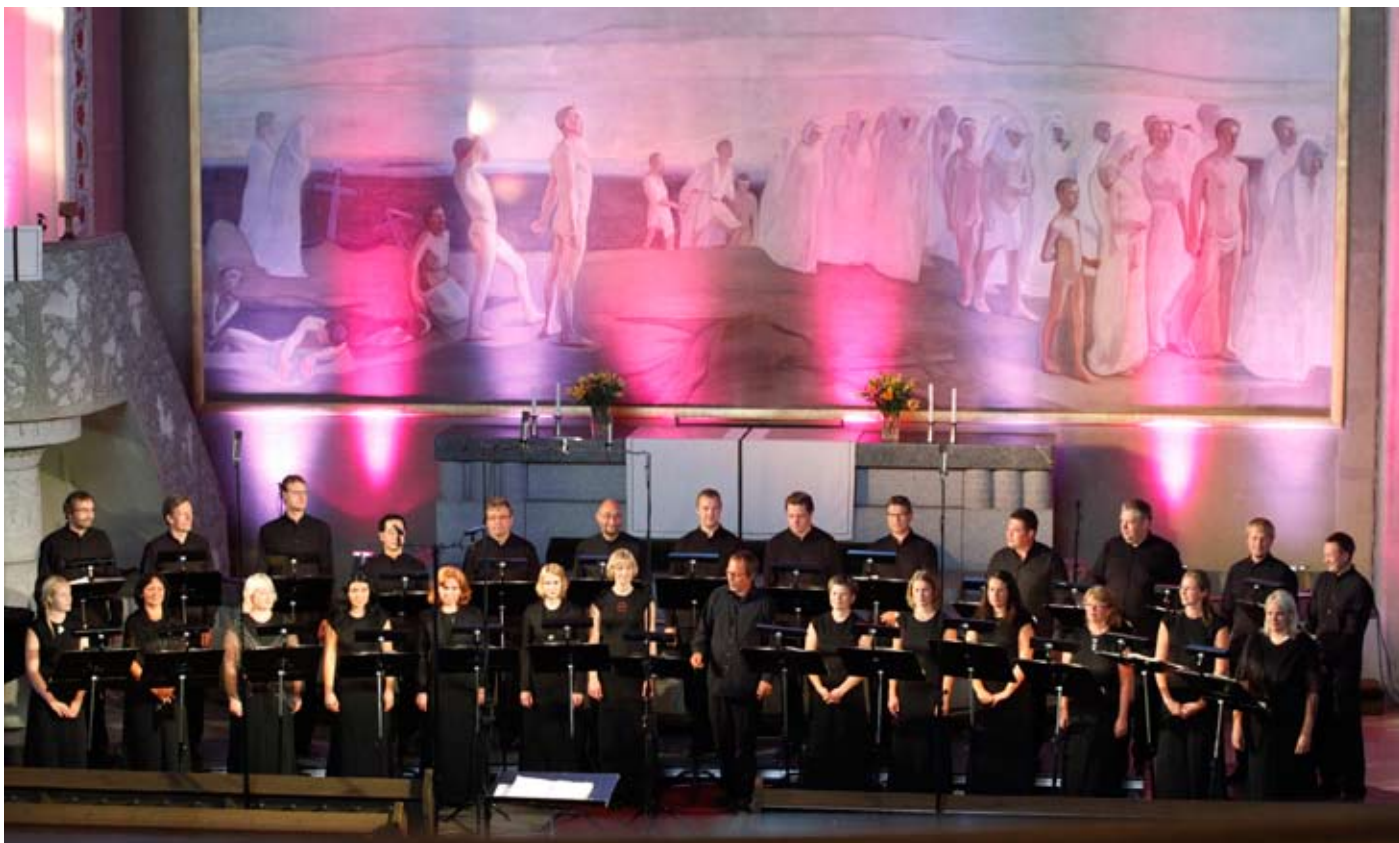
Eesti Filharmoonia Kammerkoorin konsertti Tampereen Tuomiokirkossa oli festivaalin kohokohtia.

TEKSTI | Juha Holma