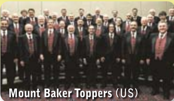
Mount Baker Toppers (US)