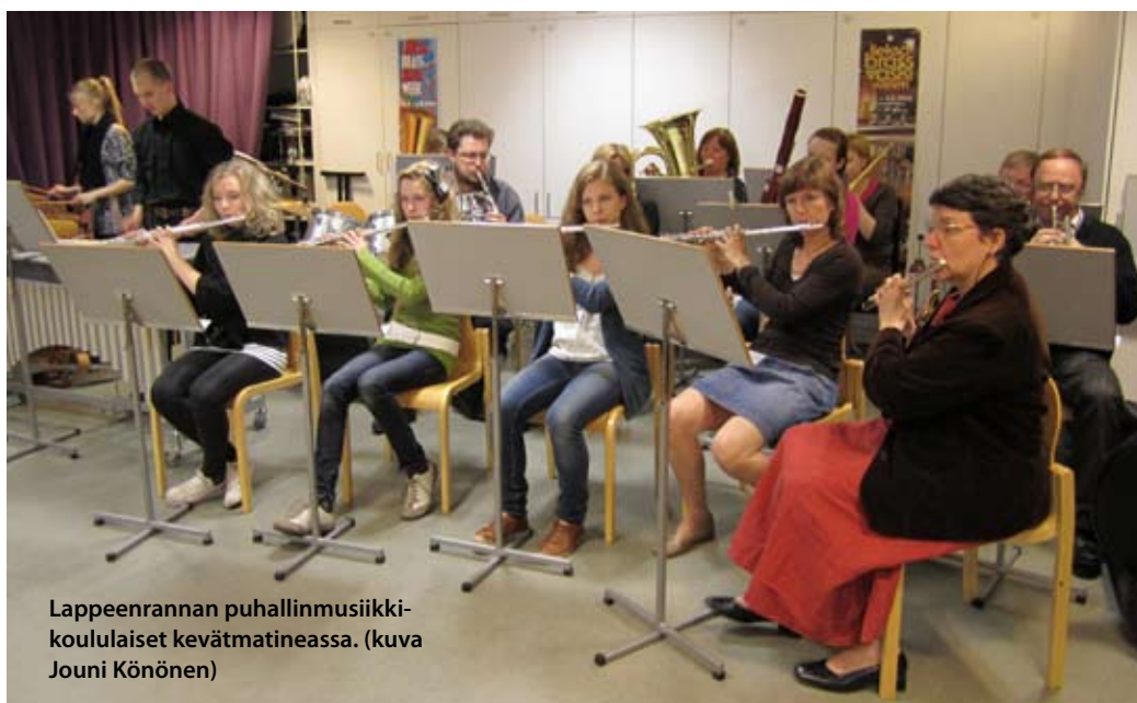
Lappeenrannan puhallinmusiikkikoululaiset kevätmatineassa.

"Opetusmateriaalit kukin opettaja valitsee oppilaan taitojen ja mieltymysten mukaan. Tärkeintä on, että harjoitetaan musiikkia