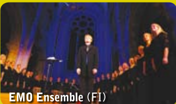
EMO Ensemble (FI)