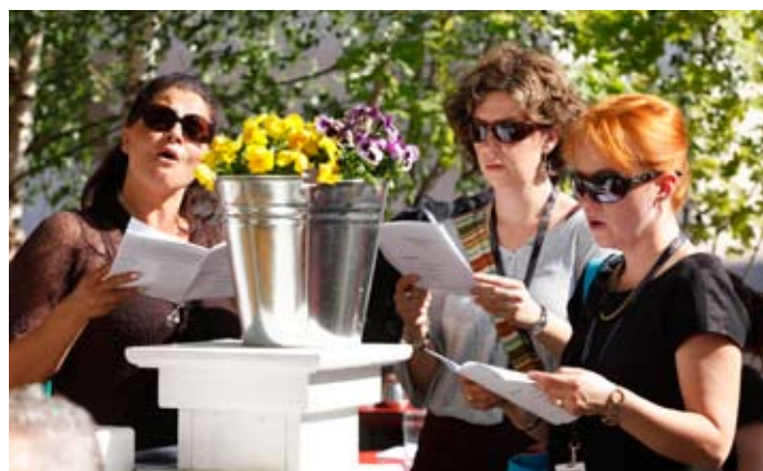
Kuorolaulut kajahtivat myös Kulttuuritalo Telakan terassilla yhteislaulutilaisuuksissa.