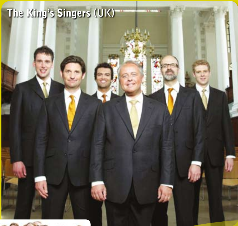
The King's Singers (UK)

Kuorojen ilmoittautuminen 29.2.2012 mennessä