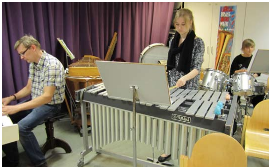
Puhallinorkesterissa on mukana myös lyömäsoittajia.

Ward kertoo toistoa olevan harjoituksissa toisaalta myös sen tähden, että siten tarjotaan ryhmän lyömäsoittajalle mahdollisuus kehittyä. Sillä välin, kun vaski- ja puupuhaltajat kamppailevat uusien sävelten oppimisen kanssa, on lyömäsoittajalle tarjottava