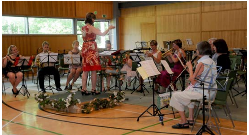
STM-Puhallinleirin D-orkesterissakin soitettiin Pyymäen puhallinorkesterikoulumateriaalia.

Nuorisopuhallinorkesterilla on monta tehtävää. Ward kertoo, että tärkein tehtävä on tukea Tampereen Työväenyhdistyksen Soittokuntaa. 5–10 vuoden päästä Música liitetään pääsoittokuntaan ja tilalle perustetaan uusi nuorisosoittokunta. Toisena tehtävänä on antaa musiikkipedagogian opiskelijoille käytännön kokemusta opetustyöstä. Kolmantena tehtävänä on tarjota jokaiselle mahdollisuus harrastaa musiikkia tavalla, joka tukee puhallinmusiikkitradiottoita Tampereella.