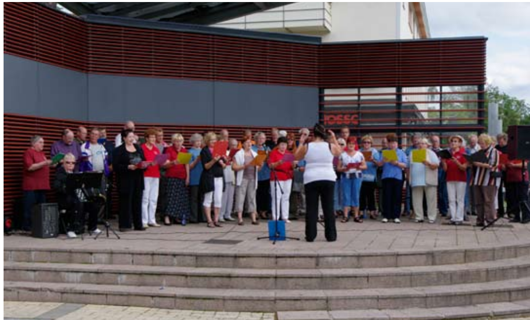
Kuoropäivät päättyivät yhteiskonserttiin Imatran kävelykadulla.

Kuoropäivien päätöspäivänä järjestettiin päätöskonsertti Imat-