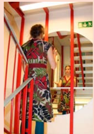
Harjoitus portaikossa tekee mestarin!

Kurssi antoi runsaasti eväitä osanottajille tulevaan työhön kuoronjohtajina. Monella olikin jo kesällä tiedossa pesti kuoronjohtajana tai oman kuoronsa varajohtajana, joten opiskelijat pääsivät siirtämään opitut tiedot ja taidot syksyn alkaessa heti käytäntöön. Ensi kesänä voikin kurssille tulla kehittämään talven aikana kypsyneitä taitoja, ja toki myös uudet kurssilaiset ovat tervetulleita tutustumaan kuoronjohdon saloihin!