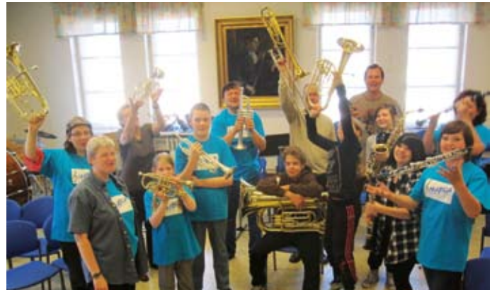
Músicasta löytyy iloista mieltä ja energisyyttä.