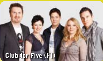
Club for Five (FI)