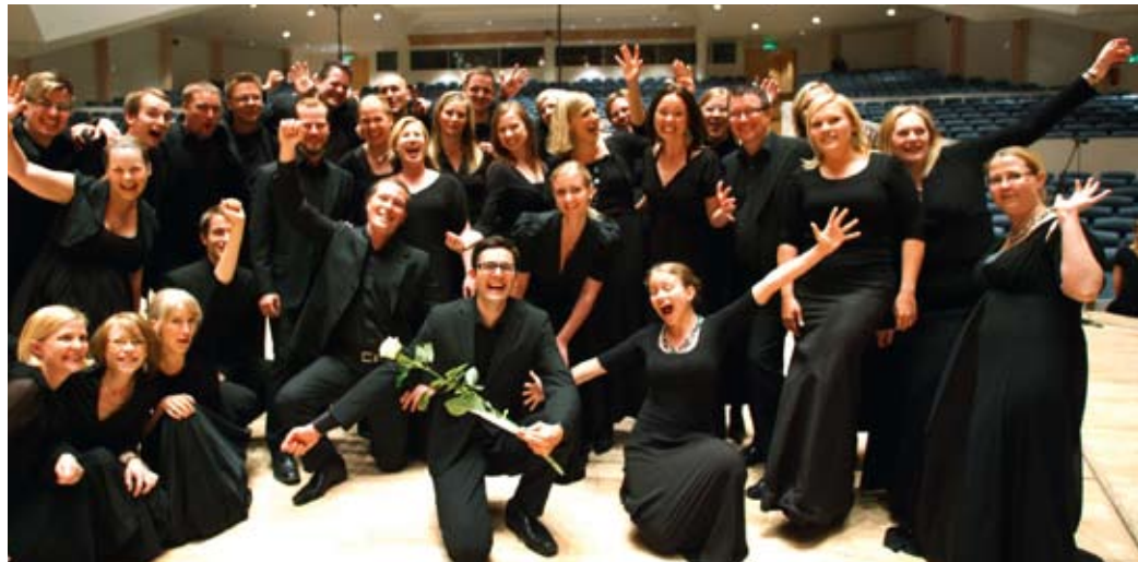
Kamarikuoro Kaamos riemuitsi kuorokatselmuksessa saamastaan Grand Prix -palkinnosta.

Katselmuksen korkeimman tunnustuksen, kolme kultaleimaa, saaneet Aino-kuoro Turusta ja KYN Helsingistä lauloivat vastustamattomalla varmuudella ja herkkyydellä lisäten joihinkin kappaleisiin myös draamallisia ilmaisukeinoja tukemaan laulujen sanomaa. Molemmille naiskuoroille kultaleimat