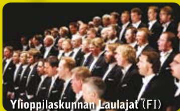
Ylioppilaskunnan Laulajat (FI)