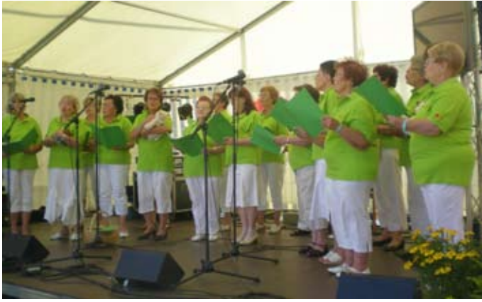
Valkeakosken Työväenopiston Naiskuoro herkisti yleisön lastenlauluilla.

nuori. Ohjelmassa kuulumme kaikki tutut laulut Kodin laittajasta Sairaaseen karhunpoikaan yleisöön oppoavina esityksinä.