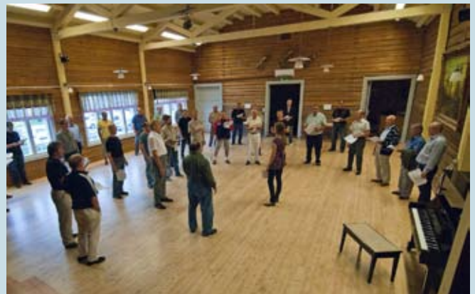
Vuoden 2010 miesten laulukurssille tulvi osanottajia.